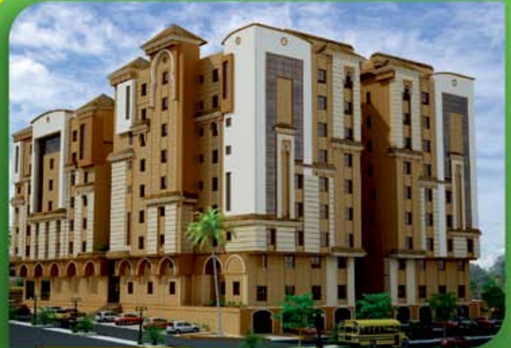
مجمع سكني تجاري ( الخبر )