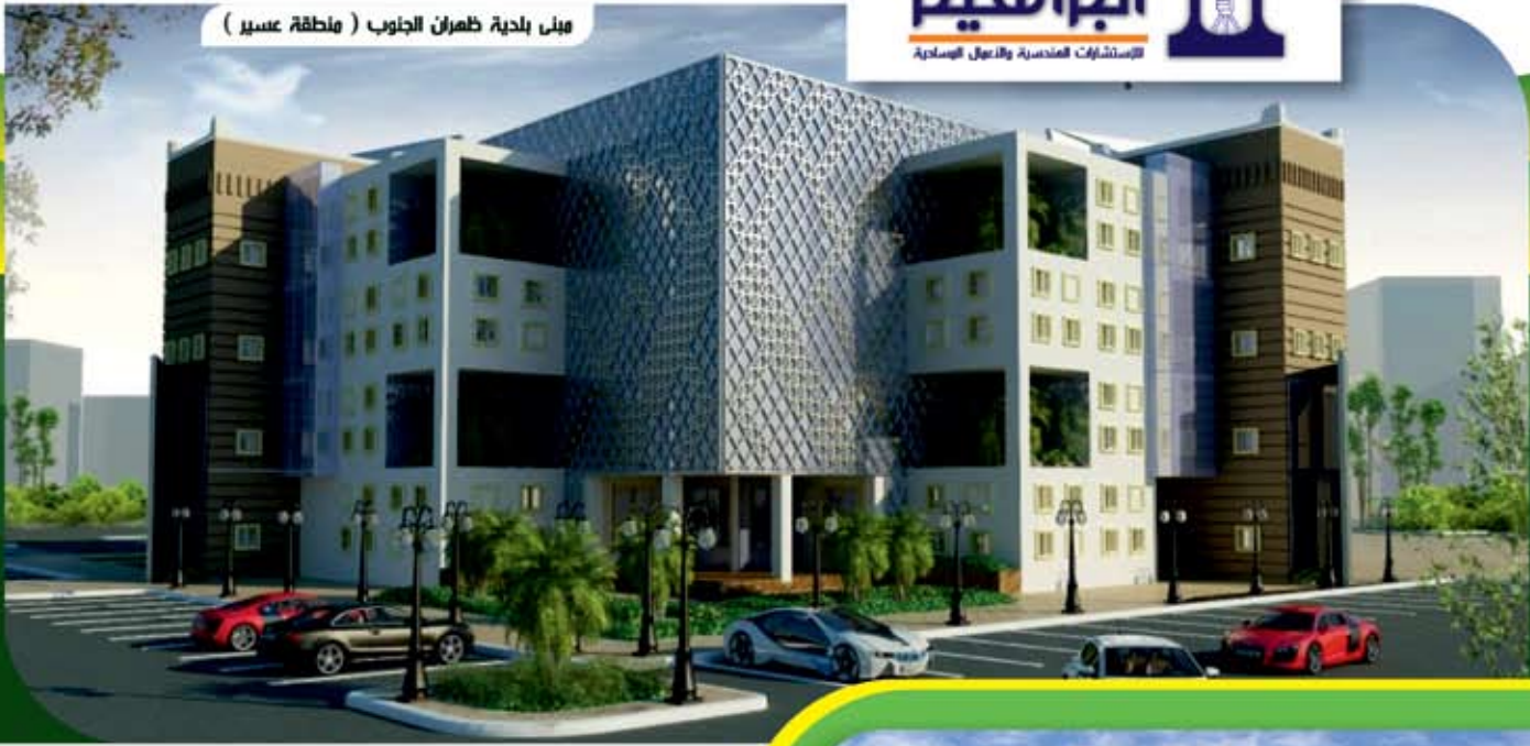
مبنى بلدية ظهران الجنوب ( منطقة عسير )