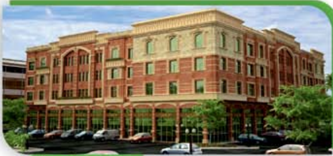
مبنى سكني تجاري ( سيهات )