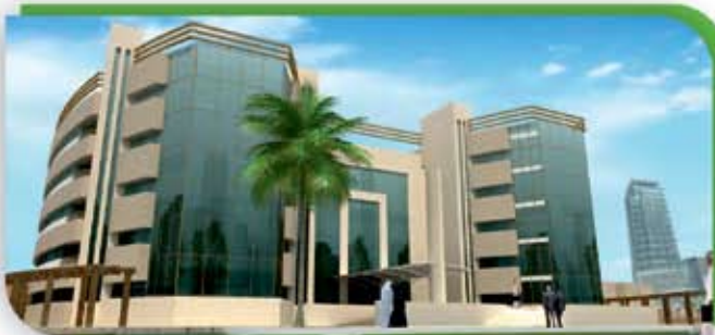
المنطقة الشرقية - مستشفى منتصف الطريق - وزارة الصحة