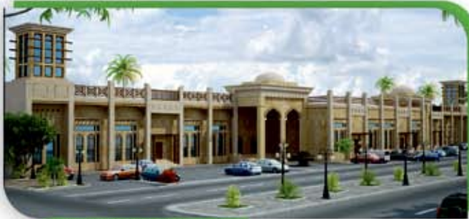
جوهرة تاروت الخيرية - صالة رياضية - تاروت