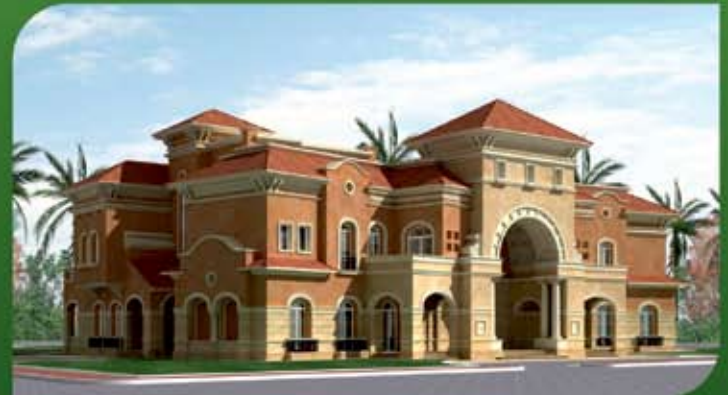
قصر سكني ( الدمام )

تصميم - إشراف - هندسة - تخطيط عمراني - إدارة مشاريع