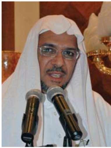
الشيخ المهندس حسين البيات