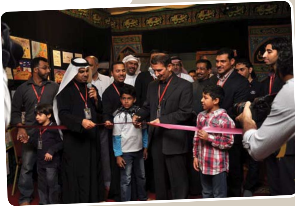
الفنان الحجي يفتتح معرض «رسالات»

وأشار في تعليقه عن المشاركات الضوئية: بأنها جاءت قليلة نوعاً ما بحكم ما تخضع له المسابقة والتقييم إلا أن مستوى المشاركات متميز.