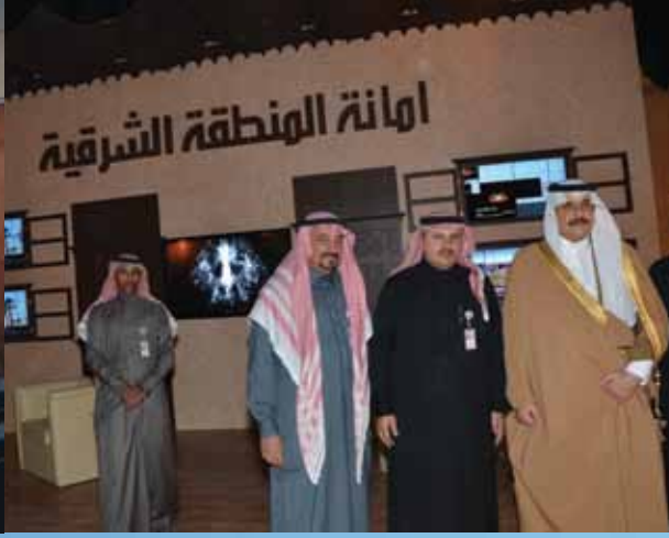
مع صاحب السمو الملكي محمد بن فهد في مهرجان الجنادرية عام ٢٠١٢م