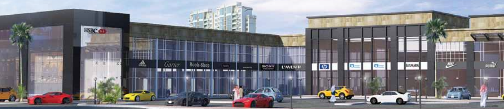
Archadia - Riyadh