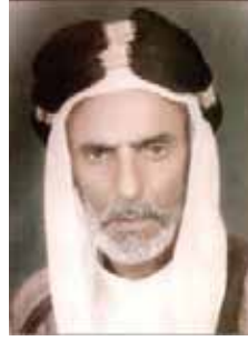
ملا عطية الجمري