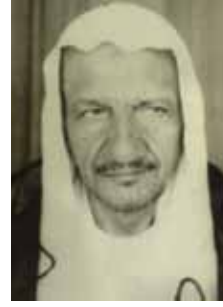
الشيخ ميرزا حسين البريكي