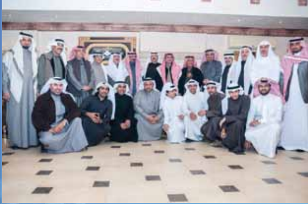
مع بعض الأصدقاء والضيوف من دولة الكويت