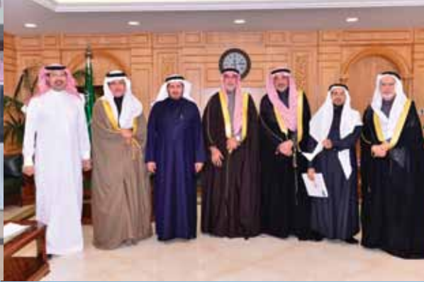
ضمن وفد من أهالي القطيف مع معالي وزير الصحة د. عبد الله الربيعية عام ٢٠١٤ م