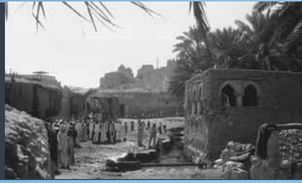
صورة قديمة لحمام تاروت وقلعته حيث ولد الضيف