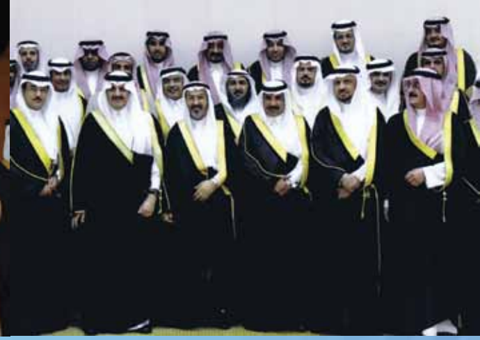
مع وفد من أمانة المنطقة الشرقية مع صاحب السمو الملكي سعود بن نايف

بطريقة صحيحة كما يمكنه الكتابة أيضا.. أما الألعاب التي تتم خارج المدرسة في فترات العصر وفي أيام الجمعة فهي ألعاب بسيطة و لها ارتباط بالبيئة المحلية و قد ذكرها الدكتور عبد الله العبد المحسن في كتابه الألعاب الشعبية . - من المعروف أن الشخص تنمو مواهبه من خلال هواياته في سنواته الأولى، فماذا كانت هواياتك حينها واستمرت معك حتى هذه اللحظة؟