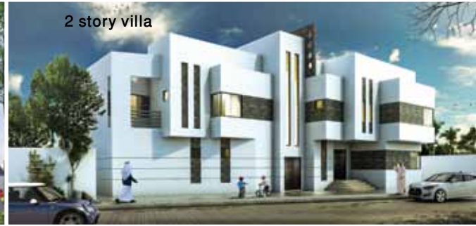
2 story villa