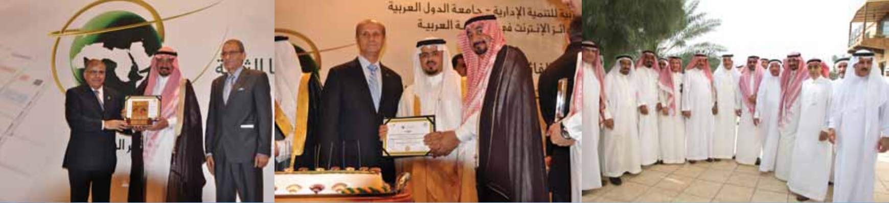
المهندس يتسلم جائزة ممثلاً لأمانة المنطقة الشرقية عام ٢٠١٢م في شرم الشيخ