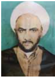
الشيخ محمد صالح البريكي