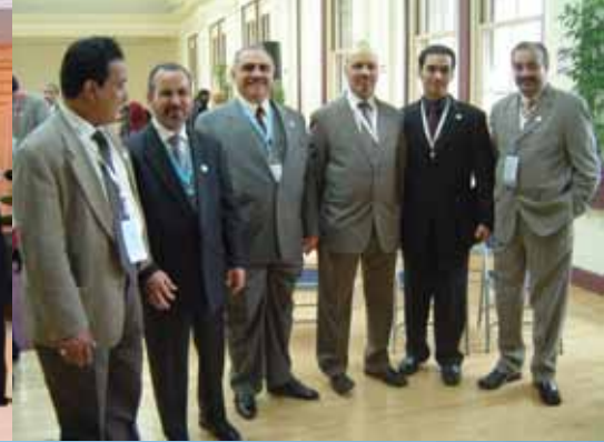
مع بعض زملائه ومعالي المهندس عادل فقيه وزير العمل عندما كان أمين جدة في أمريكا

من الكفاءات الوطنية المخلصة وأكن له كل حب وتقدير، وفي تلك الفترة شهدنا ركودا كبيرا الوجود تغيير إداري في هيكل المديرية حيث قلص دورها الإداري و سلخت منها المناطق الحيوية مثل الدمام والخبر والقطيف والأحساء وحفر الباطن، فبدافع من حب القراءة وحب العمل كنا نجلس بالأرشيف نقرأ التقارير الفنية والتخطيطية والدراسات المتنوعة وكذلك التقارير التي كان يعدها الأستاذ إبراهيم البليهي والتي تحمل جملة من المعلومات حول العديد من القضايا والمشاكل البلدية التي كان يعدها على ضوء جولات ميدانية كان يقوم بها على كافة المدن والقرى في المنطقة الشرقية، وكان يرسل تلك التقارير مع توجيهات يتم إعدادها بشكل مؤدب وأنيق إلى المسؤولين في تلك المدن والقرى، وكان المدراء يتقبلونها بكل رحابة صدر... وفي الحقيقة أن فترة الأستاذ البليهي كانت عامرة وملئية بالحرارة الإدارية وكنا نتوقع منها الكثير من الإنجازات، إلا أنه ترك المنطقة يطلب من الأمير عبد الإله أمير منطقة القصيم حينها، فغادر المنطقة، وترك ذكرى حسنة، وعين بدلا منه الأستاذ أحمد المشعل، وشهدت المديرية هدوءا مطبقا حينها استثمرت ذلك الفراغ مع بعض الزملاء لدراسة الماجستير في جامعة الملك فهد للبترول والمعادن في مجال هندسة وإدارة التشييد.