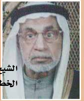
الشيخ عبد الكريم الحمود.. الخطيب المجدد والأديب الشاعر

العدد ( 38 ) - السنة الرابعة - جمادى الأولى 1435 هـ - مارس 2014 م