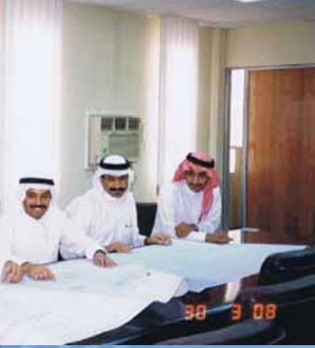
مع بعض زملاء العمل