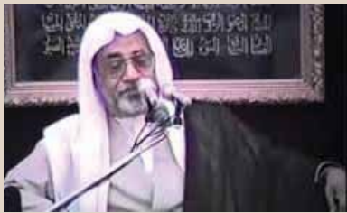
من قصائده الغزلية :