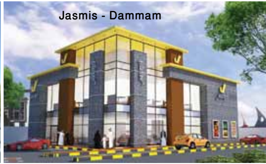
Jasmis - Dammam