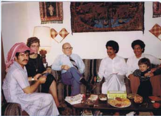
مع بعض الأصدقاء في الولايات المتحدة الأمريكية عام ١٩٨٢م