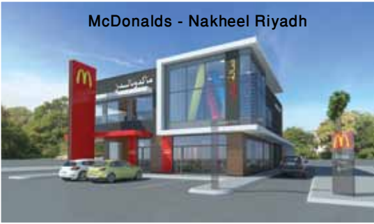
McDonalds - Nakheel Riyadh