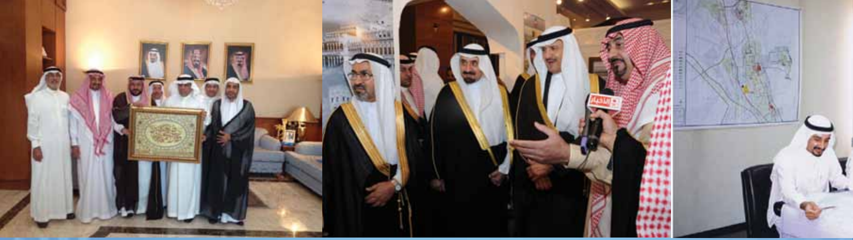
مع محافظ القطيف خالد الصفيان