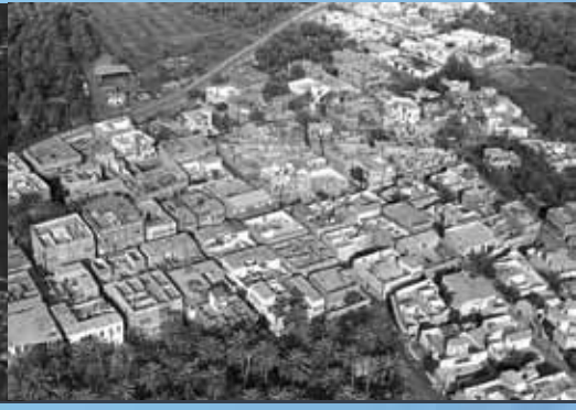
منظر جوي لحي الدشة بتاروت منشأ الضيف