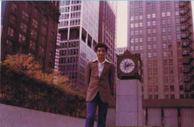
في مدينة شيكاغو بأمريكا عام ١٩٧٩م