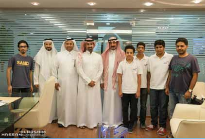
مع مجموعة من شباب نادي الروبوت بالقطيف