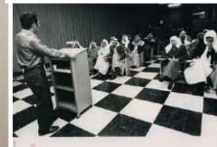
محاضرة تعريفية عن جمعية سيهات لمجموعة من الضيوف