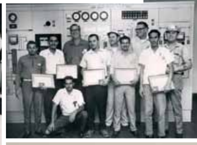
شهادات الخدمة لبعض موظفي أرامكو