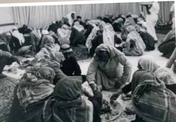
أحد الأعراس سابقاً

وحتى يتم الاحتفاظ بكل هذه الصور، أضافه الى الألبومات، والعرض في المجلس والغرف الداخلية، فإن عددا من أولاده قاموا بعملية تخزين اليكتروني إلى تلك الصور، فقد تم طبع ٥٠٠٠ صورة بتقنية المايكرو فيلم، كما تم تصميم صفحة على الفيسبوك وهناك عمل جار لتفعيلها، من اجل الاحتفاظ بالصور، وإتاحتها للعموم في