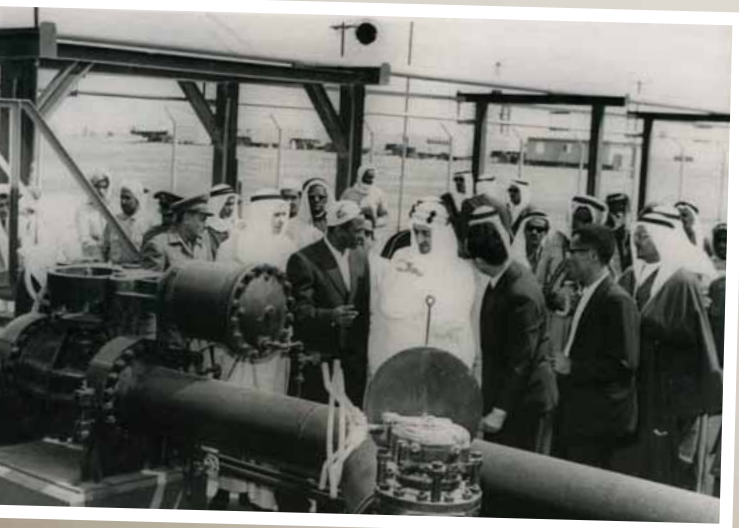
زيارة المغفور له الملك فيصل لأرامكو