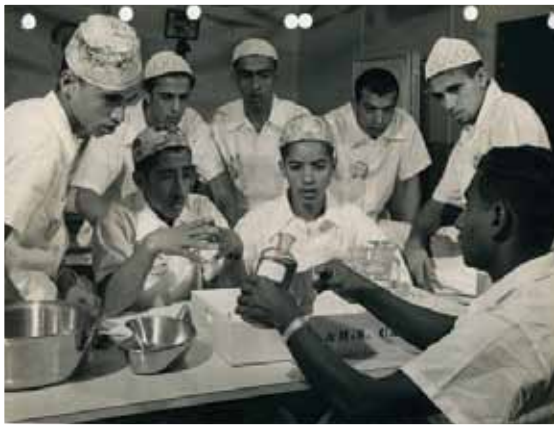
شرح لموظفي المختبر في مستشفى أرامكو