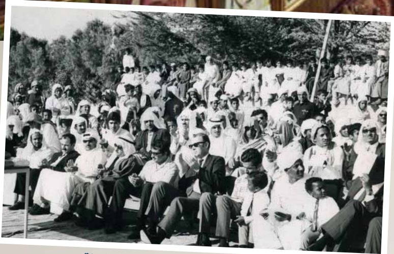
احتفال جمعية سيهات باليوم العالمي للمعاقين

أضافة إلى مجهوده الذاتي في التقاط الصور على مدار خمسين عاما، فهو يحظى بإهداءات من هنا وهناك، من قبل زملاء الهواء، ورفقاء الدرب، والاصدقاء، فضلا عن المؤسسات التي