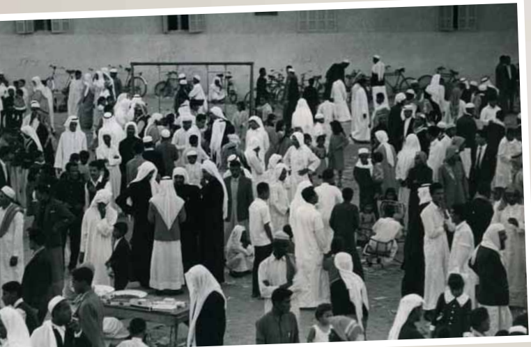
أحد الأعراس بسيهات