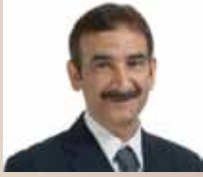
كتب / خالد السنان

جذبت أركان حرفي وتشكيل القطيف زوار معرض الأيام الثقافية المقام في مدينة ساو باولو بجمهورية البرازيل .