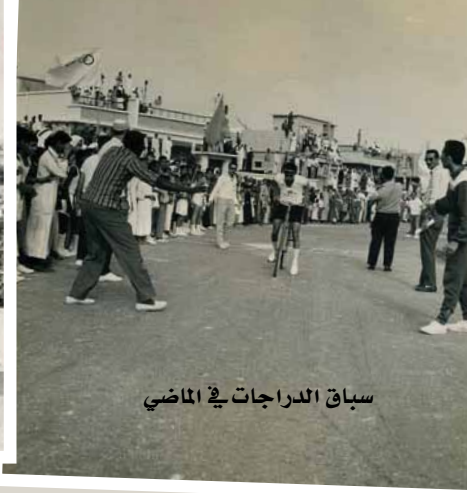
سباق الدراجات في الماضي