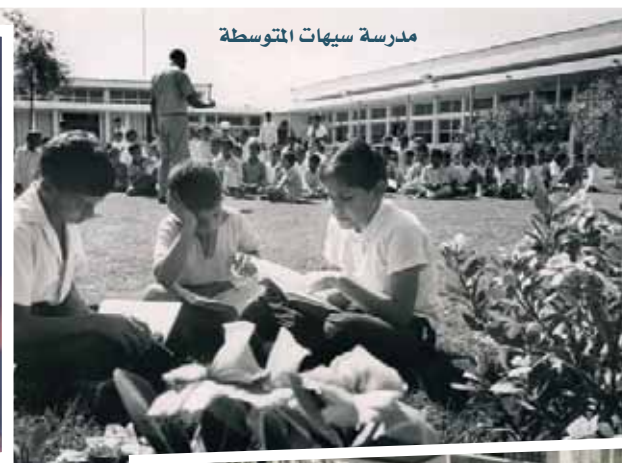
مدرسة سيهات المتوسطة