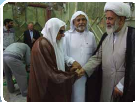
الضيف يصفاح الشيخ ضياء نجل المرجع محمد أمين زين الدين