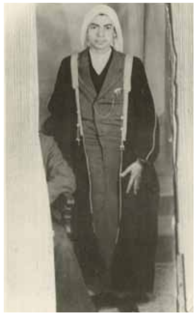
في ريعان شبابه