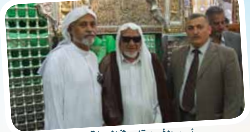
مع أحد الأصدقاء في العراق