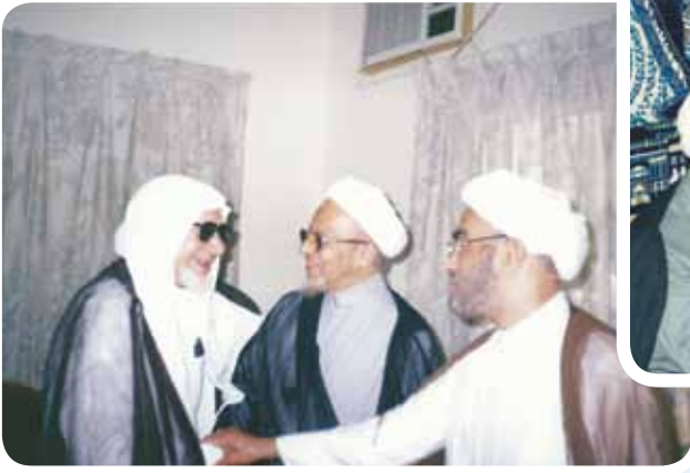
مع الشيخ عبد الأمير الجمري