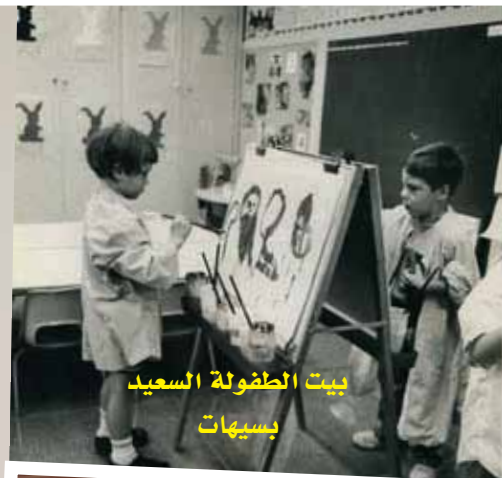
بيت الطفولة السعيد بسيهات

تلك الهواية التي جعلت آل محيف محط إعجاب وتقدير وحب قطاعات واسعة من المجتمع، التي ما فتأت تتفاعل مع هذه الهواية، بالزيارة والاطلاع، وتقديم المقترحات، فضلاً عن تقديم الهدايا وهي صور لم تلتقطها كاميرا المحيف، الذي يؤكد بأن هذه الصور هي هديته إلى هذا المجتمع، الذي تفاعل معه، طوال السنوات الماضية.