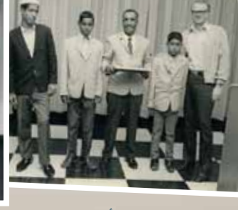
حفل تقاعد لأحد موظفي أرامكو