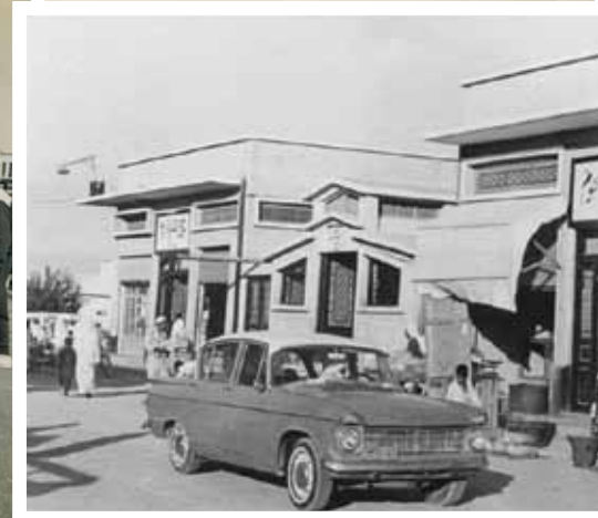
سوق اللحوم والخضار سابقاً في سيهات