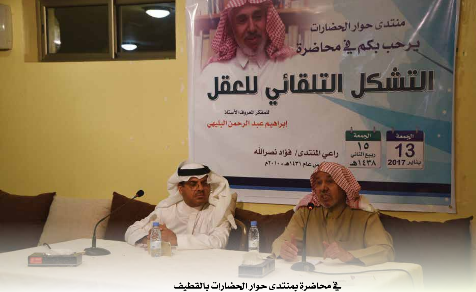
في محاضرة بمنتدى حوار الحضارات بالقطيف