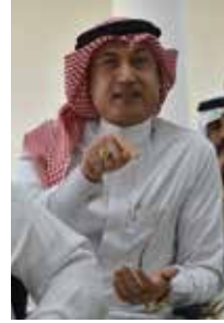
الفنان مهدي الجصاص