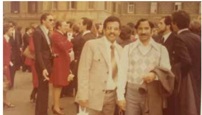
في بريطانيا لحضور إحدى الدورات الدراسية عن طريق الخطوط السعودية

في الجمعية والنادي كنت مدفوعاً بإيمان وقناعة بهذا العمل، فوظفت خبرتي في هذا الشأن، وجعلت الجمعية والنادي - بالتعاون مع زملائي - خليتا نحل.