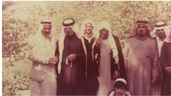
مع محمد الشريف محافظ القطيف (سابقاً) بالمرزعة