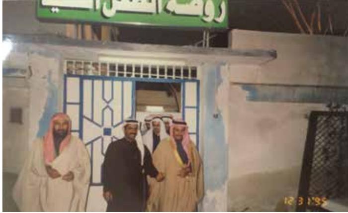
مع مدير عام الشؤون الاجتماعية بالمنطقة الشرقية في زيارة للجمعية

والنادي، وكل ما أتطلع إليه هو أن أرى هذين الكيانين في وضع متطور لخدمة المجتمع واحب أن اشكر هذه المجلة الغراء التي تسهم وبلا شك في إبراز نشاطات محافظة القطيف في شتى المجالات .. والسلام عليكم ورحمة الله وبركاته.