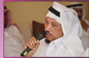
اللواء عبدالله البوشي