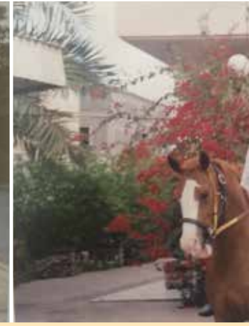
ركوب الخيل أجمل هوايات الضيف

والنادي، وكل ما أتطلع إليه هو أن أرى هذين الكيانين في وضع متطور لخدمة المجتمع واحب أن اشكر هذه المجلة الغراء التي تسهم وبلا شك في إبراز نشاطات محافظة القطيف في شتى المجالات .. والسلام عليكم ورحمة الله وبركاته.