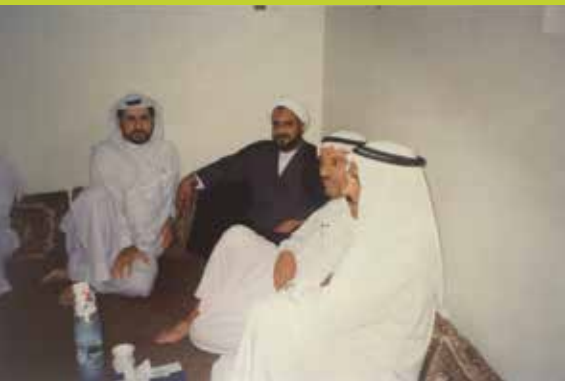
مع الشيخ عبداللطيف الشبيب في إحدى الفعاليات