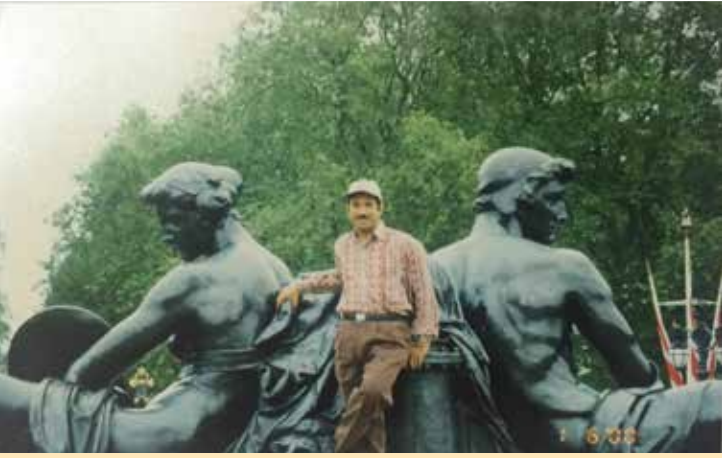
في إيطاليا لتواجد الضيف في دورة إدارة الوقت